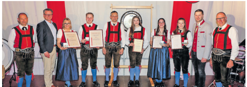
Mitglieder der Bürgermusik Mittersill mit ihren Ehrungsabzeichen