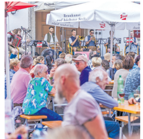
Wein und Kost

Ab 14.30 Uhr fällt der Startschuss für den Team Fun Run. Sportbegeisterte können in Dreier-Teams in den Kategorien Lauf (Damen, Herren, Mixed) oder Walking auf einer 5 km langen Strecke antreten. Das Nenngeld für Erwachsene beträgt 30 € pro Team. Besonders im Fokus stehen die jungen Teilnehmer beim Zwergal Lauf und beim Kids Lauf. Die Teilnahme ist für Kinder kostenlos und jedes Kind bekommt eine Medaille. Nach den sportlichen Leistungen geht der Nachmittag nahtlos in das Fest „Wein trifft Pinzga Kost“ über. Besucher können sich auf regionale Schmankerl und erlesene Weine freuen, die von stimmungsvoller Musik begleitet werden. Um 17 Uhr bildet die Siegerehrung und Verlosung am Stadtplatz den feierlichen Höhepunkt, bei dem sowohl die schnellsten Teams als auch die Durchschnittszeiten prämiert werden.