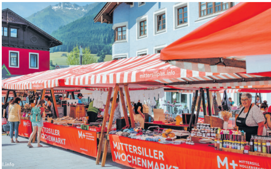
Regionale Schmankerl und italienische Spezialitäten bei den Märkten

Parallel dazu findet von Mai bis September der traditionelle Mittersiller Wochenmarkt statt. Jeden Freitag von 9 bis 13 Uhr bieten lokale Erzeuger heimische Produkte und saisonale Schmankerl aus der Region an. Der Wochenmarkt pausiert am 24. Juli und am 14. August.