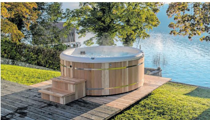
Wellness mit Aussicht: Entspannung pur am Wasser