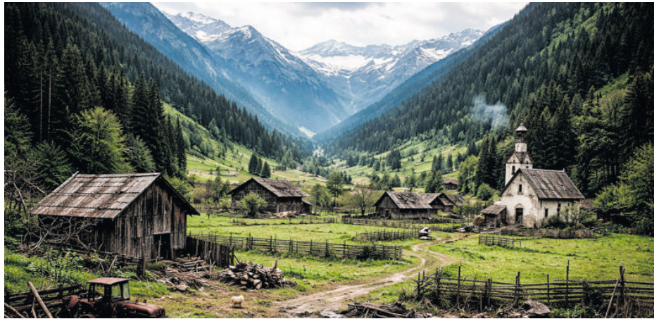
Wie würde der Oberpinzgau ohne Tourismus aussehen – ein Tal, eingefroren in der Zeit?

Überträgt man dieses Bild auf den Oberpinzgau, wird schnell deutlich, dass vieles, was hier selbstverständlich erscheint, eng mit dem Tourismus verknüpft ist. Er nährt nicht nur das Gastgewerbe, sondern wirkt weit in andere Bereiche hinein. Zahlreiche Betriebe profitieren indirekt – etwa durch Bauprojekte, Renovierungen oder die