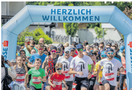
Gemeinsames Laufen

Am 16. Mai verwandelt sich das Stadtzentrum von Mittersill in eine lebendige Bühne für Sport, Gemeinschaft und Kulinarik. An diesem Tag finden der Team Fun Run und das Genussfest „Wein trifft Pinzga Kost“ gleichzeitig statt und bieten ein abwechslungsreiches Programm für alle Generationen.