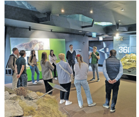
Barrierefreiheit nutzt allen: Nachhaltigkeits-Hoagascht

Vom Alpenrosenweg als Best-Practice für „Rolli-Wanderungen“ bis hin zu adventlichen Märkten ohne hinderliche Holzspäne – die Ideenliste ist lang. Barrierefreiheit stärkt die soziale Teilhabe und die Region als nachhaltige Destination.