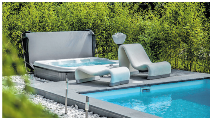
Luxuriöses Ambiente für entspannte Stunden im Freien ANZEIGE